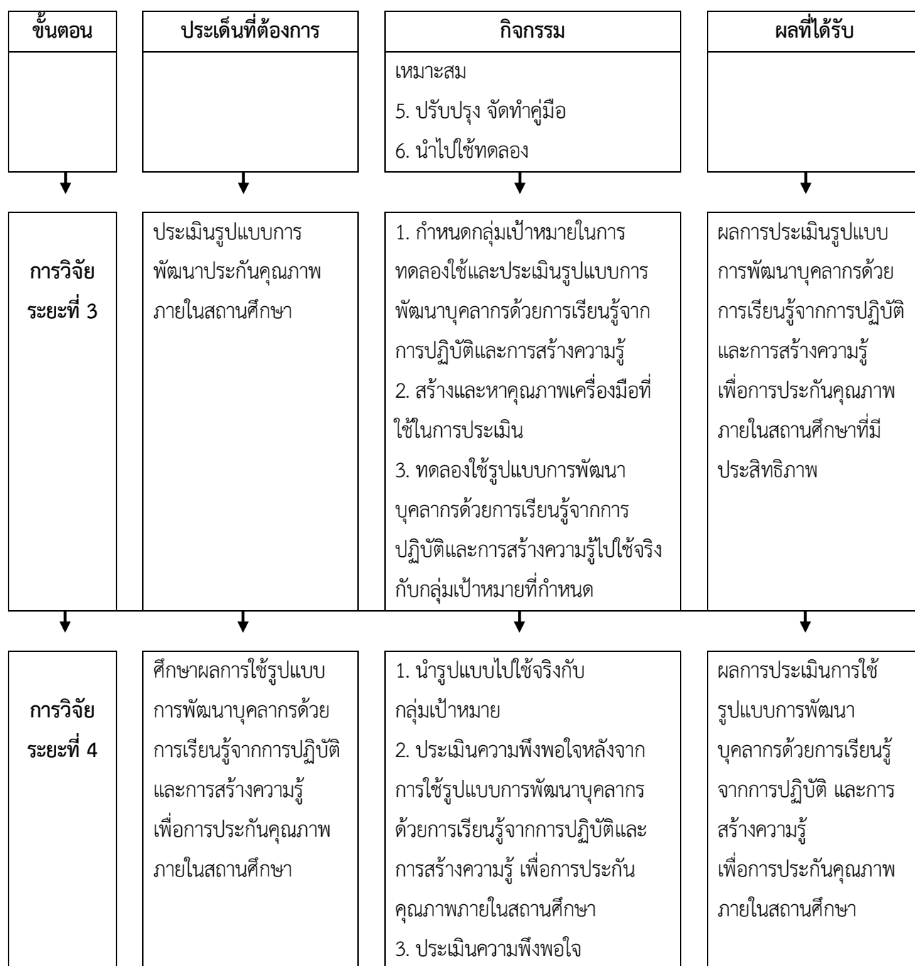
ภาพที่ 12 สรุบบนขั้นตอนการดำเนินการวิจัย

รูปแบบการวิจัยและพัฒนา (Research and Development: R&D) ดำเนินการสร้างและพัฒนา รูปแบบการพัฒนาบุคลากรด้วยการเรียนรู้จากการปฏิบัติและการสร้างความรู้ เพื่อการประกันคุณภาพภายในสถานศึกษา โรงเรียนศรีบุญเรืองวิทยาคาร จังหวัดหนองบัวลำภู มีขั้นตอนการดำเนินงาน ดังนี้